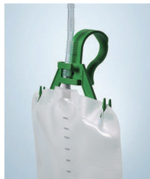
URINBEUTEL MIT GRÖßERER KAPAZITÄT